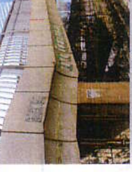
AM 2 (苔・カビ除去防止) を裏布塗了