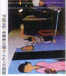
既設コンクリート面の落書き・汚れ防止