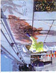
STG 5 BIO, STG 60