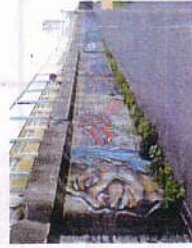
STG PRIM Color, ULTIMA AG Color