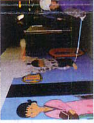
STG PRIM Color, ULTIMA AG Color