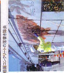
組面コンクリートの落書きの除去