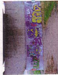
組面コンクリートの落書きの除去