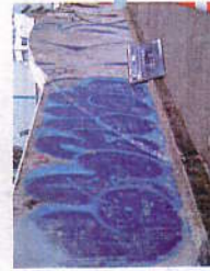
STG 3BIO, STG 5 BIO, STG 60