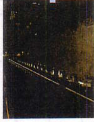
地下鉄など特殊汚れの洗浄