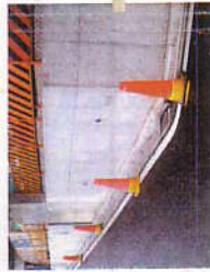
新設コンクリート面の落書き・汚れ防止